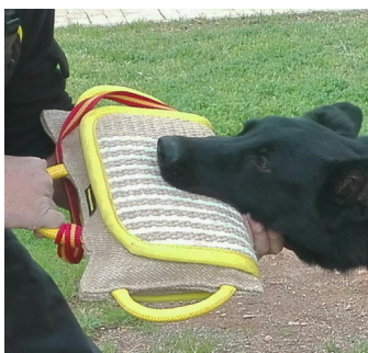
Foto: Cojín motivador canino con tres cómodas asas