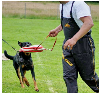
Foto: Mordedor de formación de agarre canino