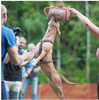
Foto: Mordedor con tres asas para adiestrar perros