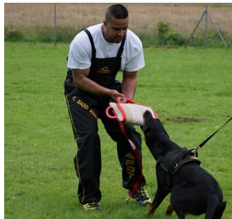
Foto: Motivador para Dóberman con tres asas