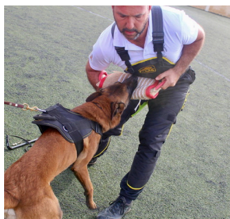
Foto: Motivador con tres asas para malinois