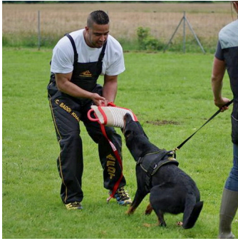
Foto: Cojín motivador de adiestramiento canino profesional